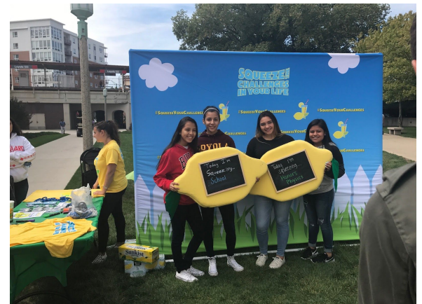
AVID Juniors en la Universidad de Loyola